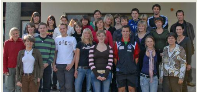
Die am Projekt beteiligten SchülerInnen der Klasse 2A der hifs Kematen mit den verantwortlichen Lehrkräften und den WissenschaftlerInnen.

Weitere Informationen: www.uibk.ac.at/ecology/forschung/klimawandel.html .