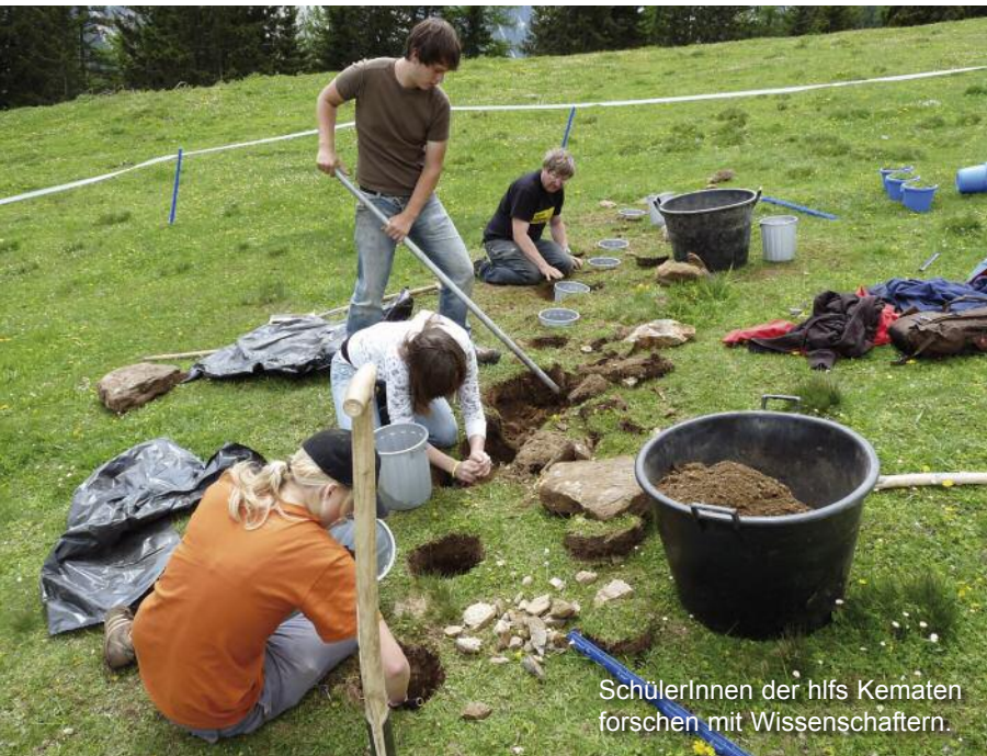
SchülerInnen der hfs Kematen forschen mit Wissenschaftlern.

Top-Klima-Science - Wissenschaft und Schule forschen