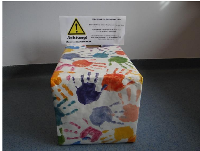
Abb. 2. Stöpselsammelbox

Mit dem Slogan „Kleine Aktionen bewirken Großes“, starteten wir top motiviert mit unserem Projekt. Wie man auf dem Bild sieht bastelten wir Sammelboxen für Plastikstöpsel.